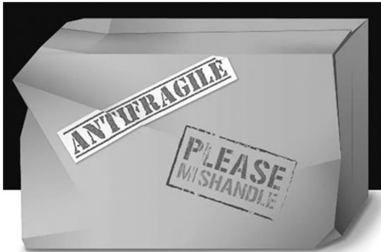
Рис. 1. Посылка, на которой отправитель написал: «Антихрупкое» и «Кантовать!». Ее содержимому нравятся стрессоры и хаос. Ил. Giotto Enterprise / Джорджа Насра.

Чтобы удостовериться в том, что эта концепция нам чужда, повторите эксперимент: попросите людей на следующем деловом собрании, пикнике или сходке перед демонстрацией протеста назвать антоним слова «хрупкость» (не забывайте уточнять, что имеется в виду полная противоположность этому понятию, нечто с обратными свойствами и противоположной реакцией на стресс). Скорее всего, кроме